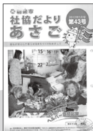
あさごふれ愛の郷のぞみ 宿泊訓練スタート