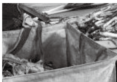
ねぎの泥落とし、皮むき