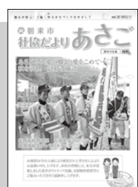
障がい者(児)相談 支援事業開始