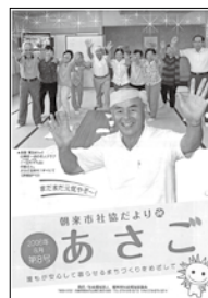
YOU・愛センター オープン ヒメハナ作業所 開所式