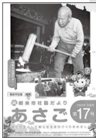
小規模多機能 施設おくらべ 開所