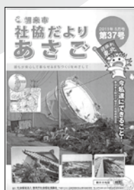
東日本大震災 被災地 支援のため職員派遣