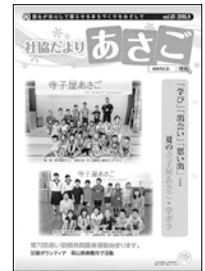
岡山県豪雨災害倉敷市 災害ボランティアセンター 職員派遣