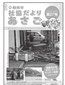
台風9号による被害 朝来市ボランティア センター設置