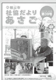
市内 小学校区単位に 地域支援員を 配置