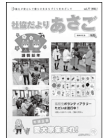
地域おたより便 「やっどるでえ〜」 ケーブルテレビ 放送開始