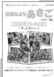
地域応援 助成事業開始