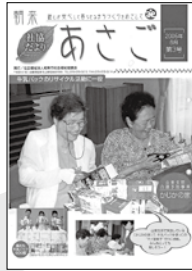
朝来市社協キャラクター名 「あさまるくん」に決定！