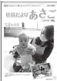
組織改編 地域福祉課⇒総合支援課 支所⇒地域センター 等