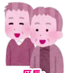
区長・ 民生委員訪問

区長や民生委員さんも積極的に関わりを持っていただき 民生委員さんからは移動スーパー「とくしまる」の手配をもして頂けるようになった。