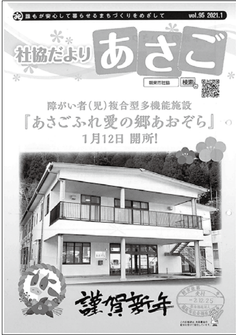
複合型多機能施設あさごふれ愛の郷あおぞら開所