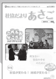
生活支援Co配置、 社協委員配置