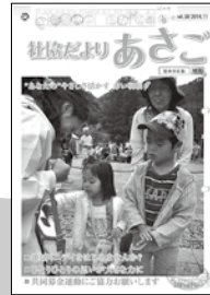
豪雨災害のため 丹波市、福知山市 災害ボランティア募集