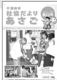
あさまる支援事業 開始