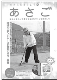
デイサービスセンター えんやオープン