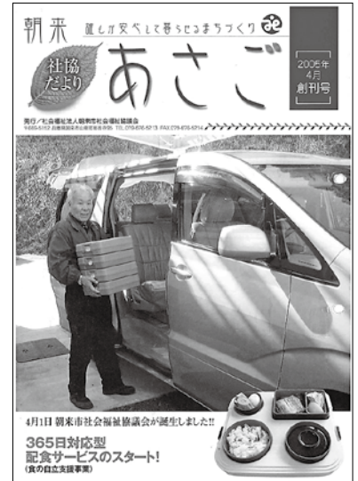
朝来市社会福祉協議会誕生 365日対応型配食サービス スタート