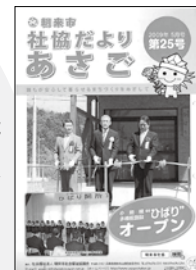
小規模多機能 施設ひばり オープン