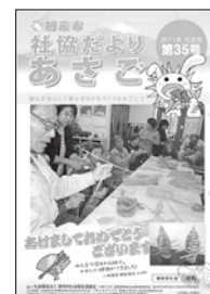
5つの作業所が あさごふれ愛の郷へ 統合